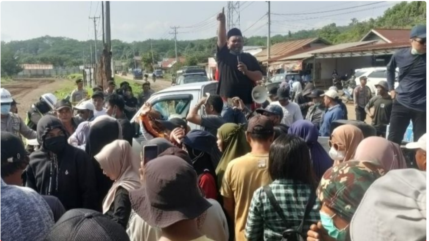
Tampak Korlap Aksi Demo Menyampaikan Orasinya di depan Kantor AFB Desa Lalampu

MOROWALI, Sulawesi Tengah- Tuntutan Aksi Demo yang dilakukan sejumlah warga Desa Lalampu masih menunggu keputusan dari PT Ang and Fang Brother (AFB) perusahaan tambang yang berlokasi di desa tersebut.